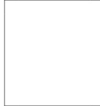
Right index fingerprint of alien removed

_____ (Signature of alien being fingerprinted)